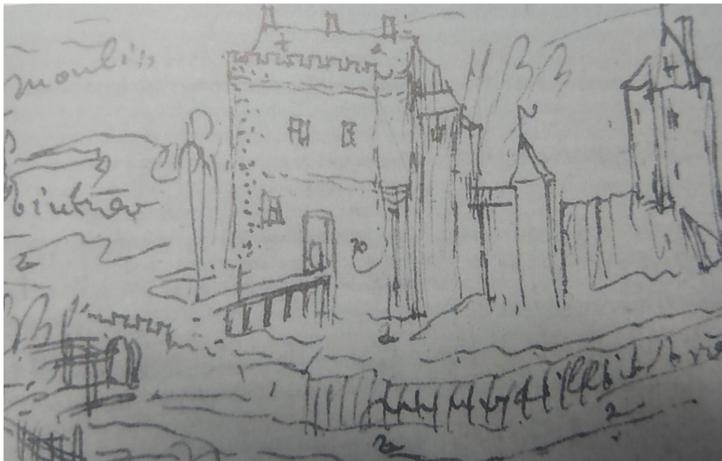
Représentation du château dans les albums de Croÿ vers 1605.

La Meullemotte est un lieu historique situé au nord-ouest de la place du village, on y trouvait le château et un poste de fortifications (établis sur une motte).