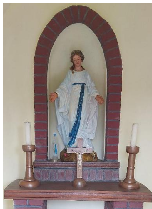
INTÉRIEUR DE LA CHAPELLE RÉNOVÉE ET ENTRETENU PAR DES BENEVOLES