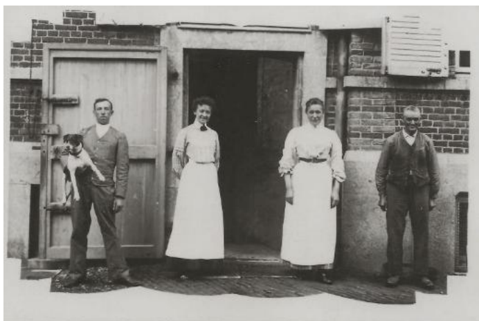
LES DOMESTIQUES DU CHÂTEAU date inconnue