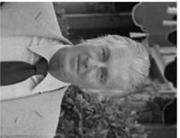
Hubert de Givenchy en 1972

Louise de Saint-Just meurt en 1894. Léon de Givenchy demeure au château jusqu'à son décès le 3 février 1914. Le château est occupé par les troupes anglaises, mais il est touché par un bombardement en 1918. Délabré et dans un triste état en 1919, les enfants décident de le vendre. L'acheteur le démolit et vend les matériaux.