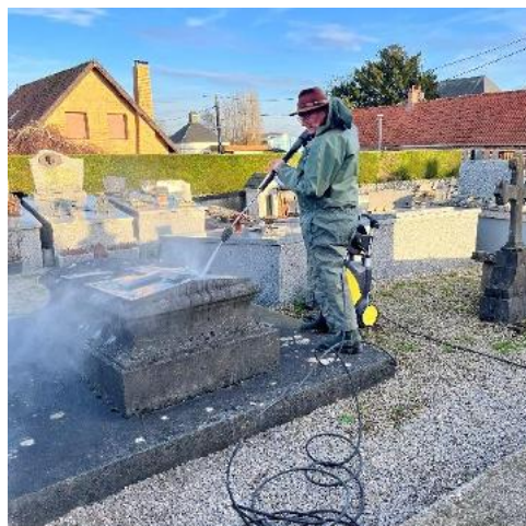
NETTOYAGE DE LA TOMBE TAFFIN DE GIVENCHY DE SAINT JUST D'AUTINGUES AU CIMETIÈRE D'EPERLECQUES janvier 2026